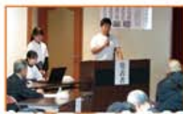
ボランティア交流広場