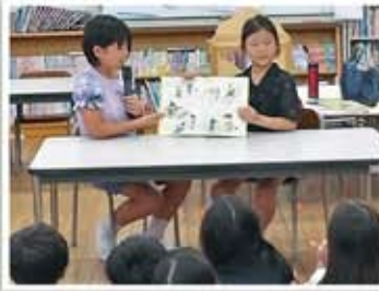
宇ノ気第1、2学童保育クラブ

子どもたちに読み聞かせの楽しさを知ってもらおうと、「おはなし円グループ」さんにご協力をいただき、今年度は学童保育クラブに通う児童を対象に1年を通じて開催をしています。