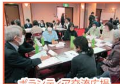
ボランティア交流広場