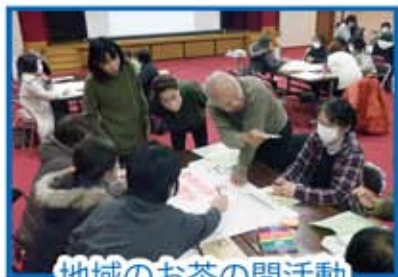
地域のお茶の間活動