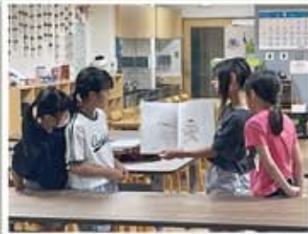
宇ノ気南部学童保育クラブ