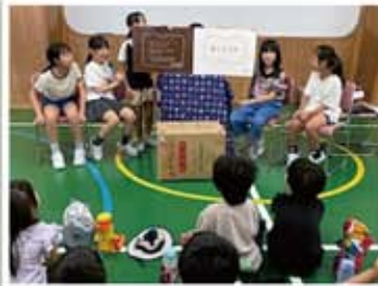
外日角学童保育クラブ