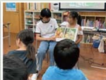
大海学童保育クラブ